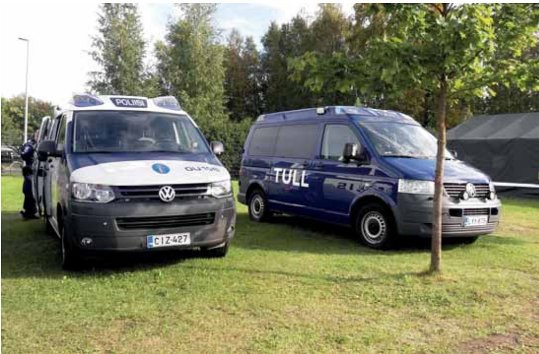
Kyberrikollisuuden takaamiseksi tarvitaan vankkaan kansainvälistä yhteistyötä eri maiden kyberasian-tuntijoiden, kyberturvallisuuskeskusten, lainvalvontaviranomaisten ja palvelujen tarjoajien kesken.

Rautio jatkaa, että etenkin yritysten kannattaa varautua ja panostaa kyberturvalliseen toimintaan, koska pahimmillaan palvelunestohyökkäys, kiristyshaittaohjelma (ransomware) tai yritysvakoilu voi kaataa toiminnan tai tahrata yrityksen maineen lopullisesti.