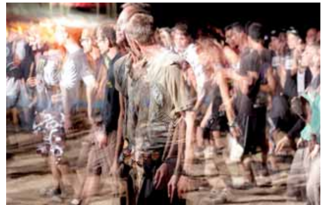
VERKON SANASTO HALTUUN S. 6