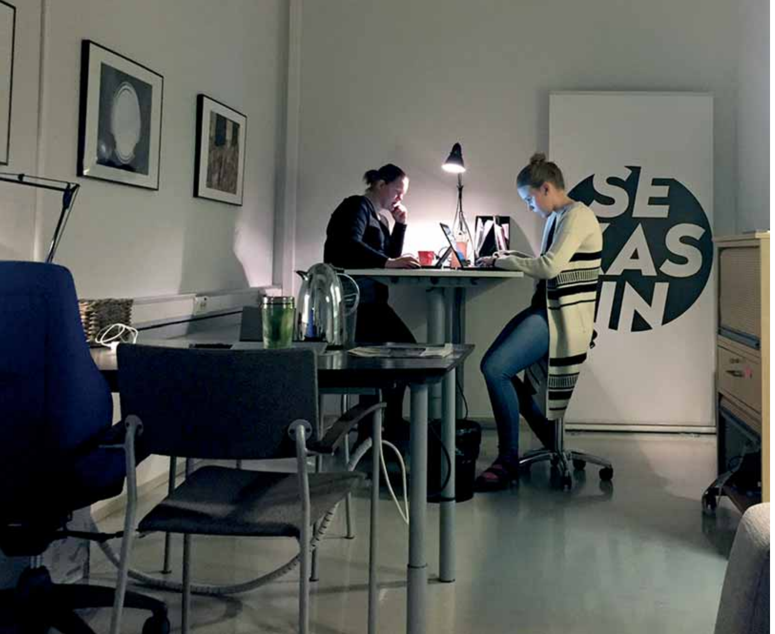
Kuva: Malla Tirkkonen