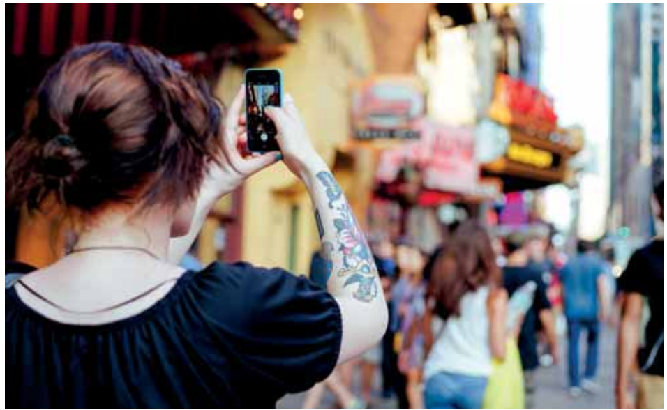
LAILLISEN JA LAITTOAMAN RAJA KUVAAMISESSA JA KUUNTELUSSA S. 29