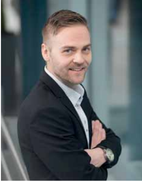
Juha T. Virtanen, kuva Vakuutusyhtiö IF

uuden pyörän. Rahallinen korvaus perustuu jälleenhankinta-arvoon. Korvauksesta vähennetään mahdolliset ikävähennykset ja omavastuu, hän kuvailee.