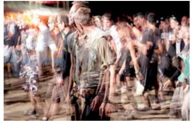
VERKON SANASTO HALTUUN S. 6